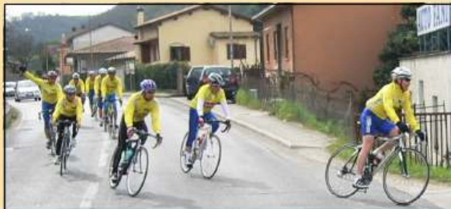
Turbikers prima della salita di Torrita Tiberina