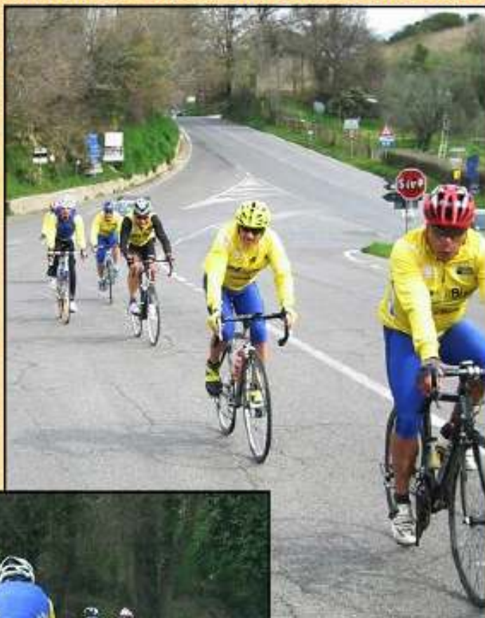
Turbikers in azione durante la tappa di S. Oreste.